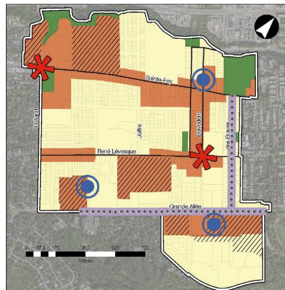
Schéma conceptuel d'aménagement et de développement relatif aux activités et à la vocation du territoire ainsi qu'au cadre bâti